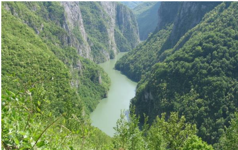
Кањонска долина ријеке Лим

Долина Лима пружа се правцем југ-сјевер. Ту су смјештене веће рељефне цјелине, поља настала у проширењима сложене котлине ријеке Лим: увачко, миочко, устибарско, обрвенско и мрсовачко, док је већи дио поља у Мрсову потопљен водом изградњом вишеградске хидроелектране.