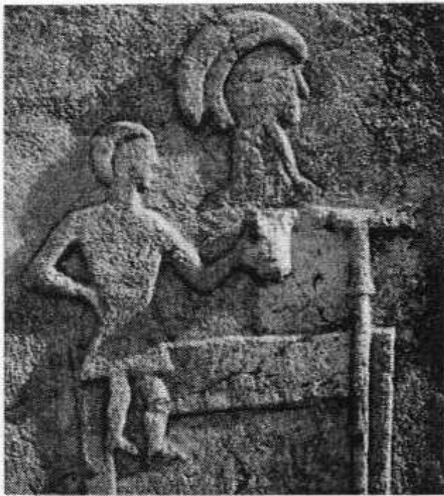
Сл. 5 Бања Стилјена, Рогатица