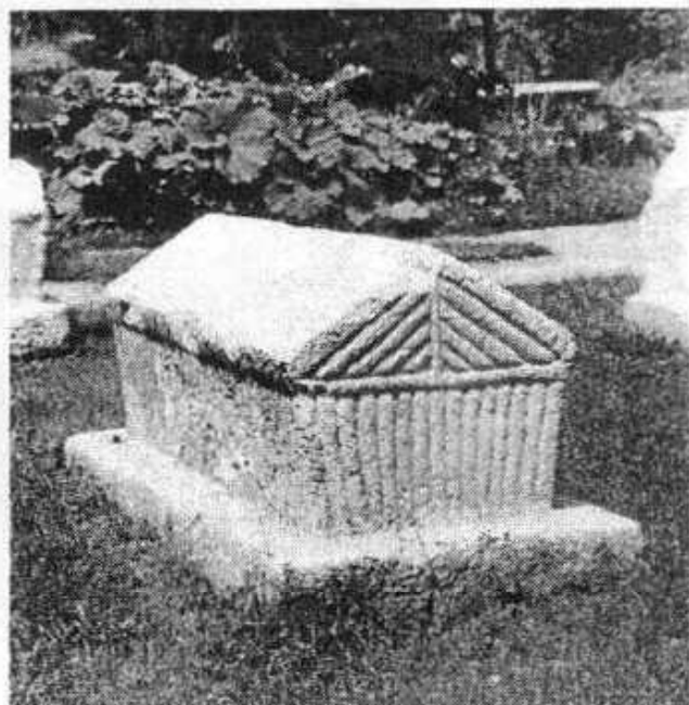
Сл. 4 Доњи Бакићи (Клиса), Олово