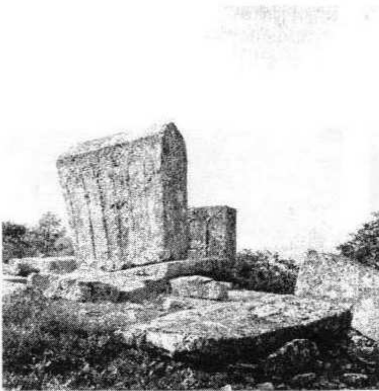
Сл. 7 Радмилићи Дубраве, Билећа