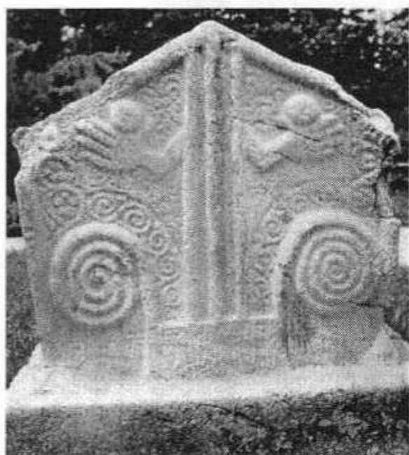
Сл. 3 Варошиштије (Беговине), Рогатица