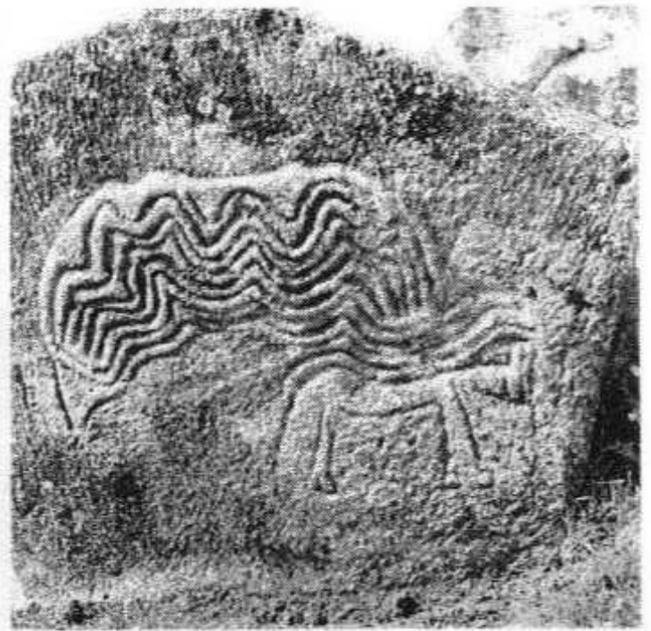
Сл. 6 Варошиште (Беговина) Рогатица