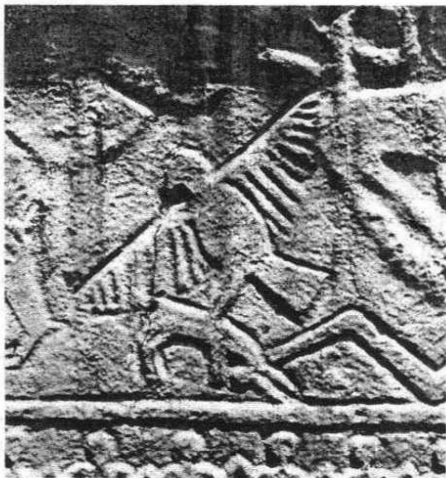
Сл. 11 Бротњице, Цвѣтати