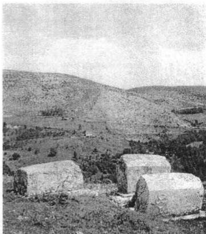
Сл. 1 Хреша, Сарајево