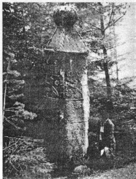
Сл. 2 Доњи Бакићи (Влашковац), Олово