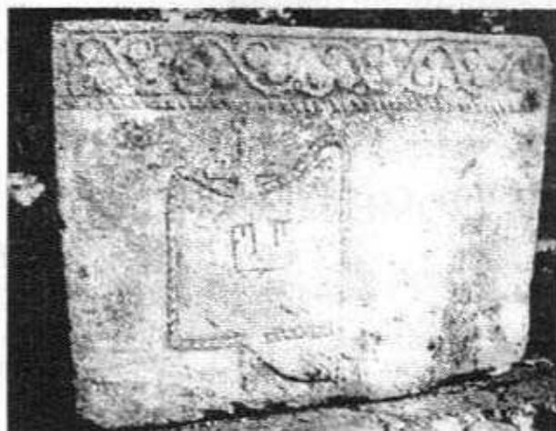
Сл. 10 Бољуни, Столац