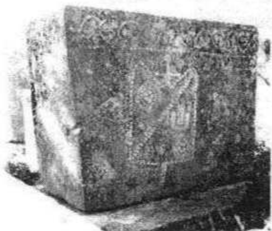
Сл. 9 Бољуни, Столац