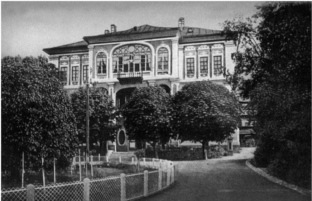
Rezidencija Konak bila je sjedište zemaljskog poglavara za Bosnu i Hercegovinu u vrijeme austrougarske uprave. Svoju rezidencijalnu namjenu zadržala je do danas.

Na drugom zasjedanju birali su se saborski odbori, govorilo o jezičkom pitanju, raspravljalo o cestama, o nepravilnostima pri izdavanju zakupa tuzlanske soli, raspravljalo o budžetu koji je na drugom zasjedanju i odbijen, kritizirala policijska sila tokom đaćkih demonstracija pred sarajevskom katedralom protiv bana Cuvaja i uvođenja komesarijata u Hrvatskoj. Kako se Vlada našla u sukobu s cijelim Saborom, odlučila je da zatvori drugo zasjedanje.